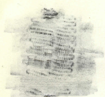
band i nat.storlek